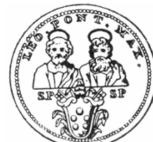
교황 레오 10세의 메달 개혁 이전