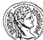
카이사르 아우구스투스의 동전 (주전27-주후14)