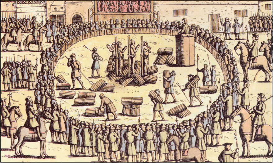
순교자들의 처형지로 유명한 스미스필드에서 화형 당하는 순교자들