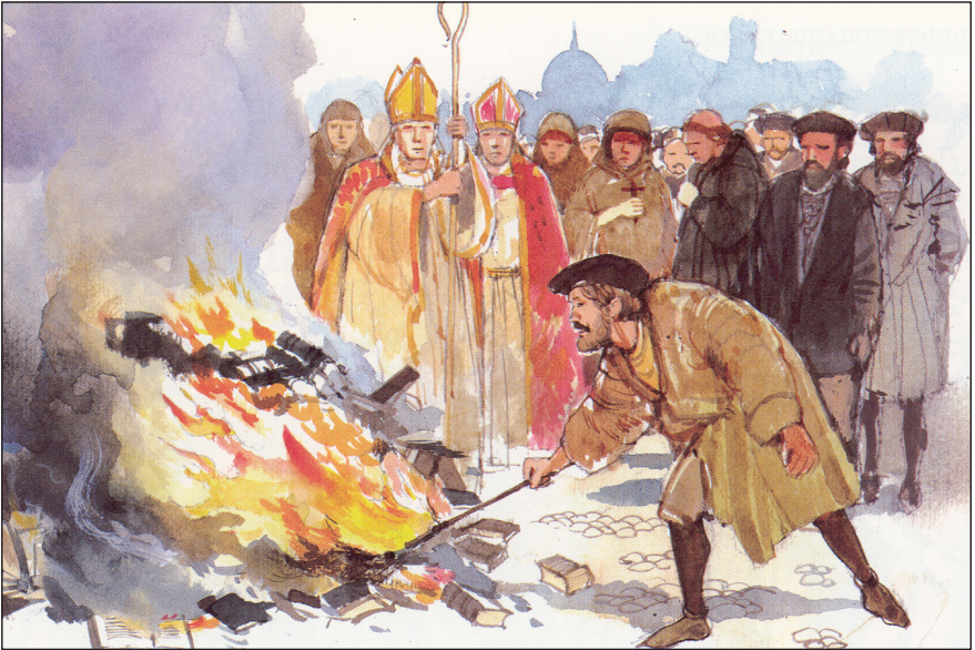
성경을 불태우는 카톨릭 사제들