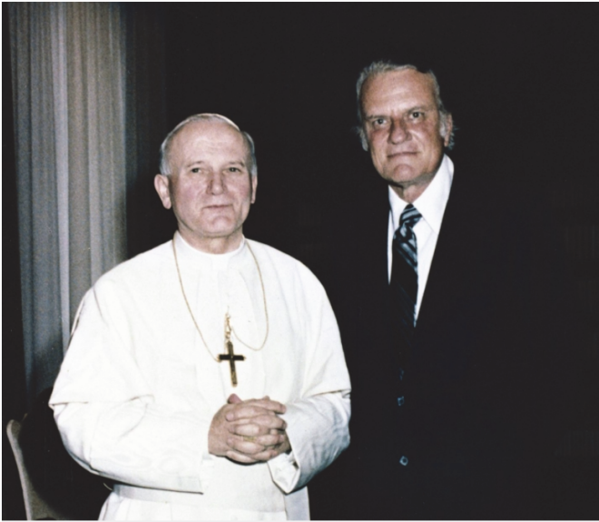
Pope John Paul II and Billy Graham in 1981